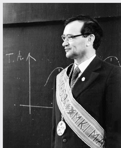
18 марта 1980 года

Посетить экспозицию может любой желающий с понедельника по пятницу до 18:00.